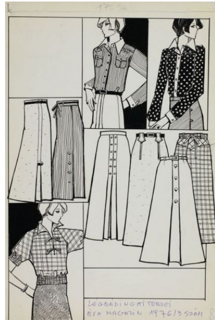
LÉGARÁDI NCI TERVEI EVA MAGAZIN 1976/3 SZÁM