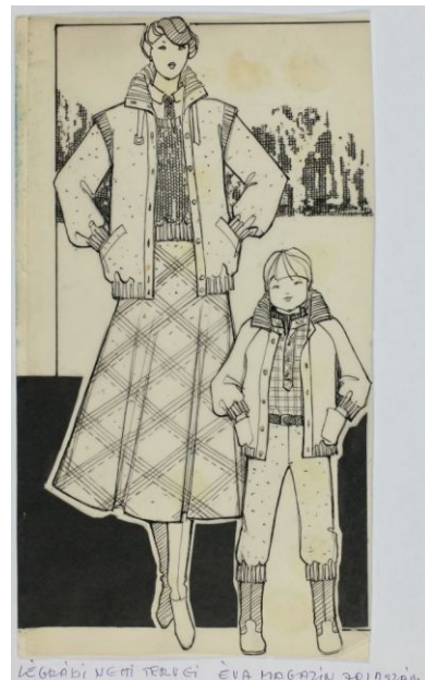
LÉGARÁDI NCI TERVEI EVA MAGAZIN 1976/3 SZÁM